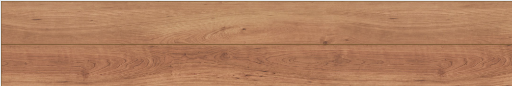
ブラックチェリー柄 (BC)